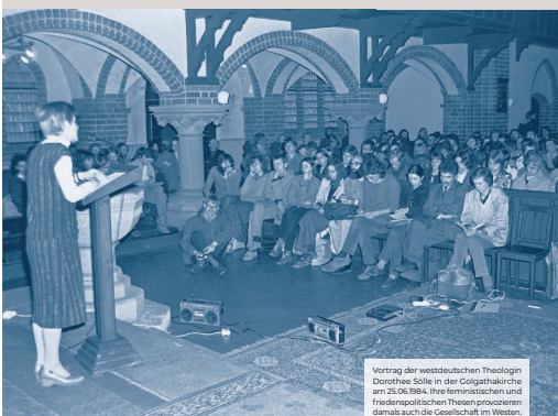
Vortrag der westdeutschen Theologin Dorothee Sölle in der Golgotahirche am 25.06.1984. Ihre feministischen und Friedenspolitischen Thesen provozierten damals auch die Geistlichkeit im Westen. Lecture by the West German theologian Dorothee Sölle in the Golgotha Church on June 25, 1984. At the time, her feminist and peace policy positions were provocative, also in Western society.

The heart of the Language Konvikt was its comprehensive library. It gave students access to specialized and other literature from the West that was withheld from most readers in East Germany. The books were brought in – often with the help of the Church College – via convoluted, frequently illegal ways. Some people unaffiliated with the Language Konvikt were also able to use the library.