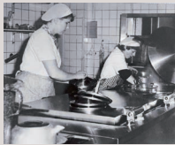
In der Küche des Konvikts Anfang der 1980er Jahre. Gemeinsame Mahlzeiten gehören ebenso zum Alltag wie die Jahresfeste. Auch Reparaturen im Gebäude führen Studierendende Dozenten oft selbst durch. The Konvikt kitchen in the early 1980s. Eating meals together was just as much part of the everyday routine as the annual parties. And repairs in the building were often done by students or lecturers.

independent academic training institution of the church. The faculty was made up of young, recently certified lecturers, as the seminars in West Berlin could no longer be attended. It was possible to raise the status of the training