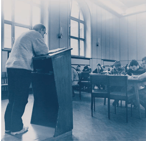
Tafel B-1 (Sprachenkonvikt - Lehre und Leben)