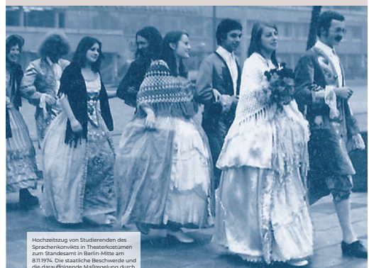
Hochzeitstag von Studierenden des Sprachenkonvikts in Theaterkostümen zum Ständesamt in Berlin-Mitte am 8.11.1974. Die staatliche Beschwerde und die darauffolgende Maßregelung durch die Dozenten führt zu einem Konflikt zwischen der Konviktsleitung und der Vertretung der Studierenden. Wedding procession of Language Konvikt students in theater costumes to the registry office in Berlin-Mitte on November 8, 1974. The state complaint and the subsequent disciplinary measures by the lecturers led to a conflict between the Konvikt administration and the student representatives.