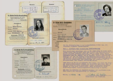
Studentenarbeitsweise aus verschiedenen Jahrzehnten und die schützende »Schweigekarte« – Student ID cards from various decades and the protective nondisclosure agreement »Schweigekarte« in Berlin, East Germany and West Germany

Das Sprachenkonvikt steht unter Beobachtung. Behörden, Partei und das Ministerium für Staatssicherheit (Stasi) sehen dort wiederholt »feindlich-negative« Kräfte am Werk. Besonders in den Anfangsjahren behindern staatliche Auflagen den Studienbetrieb massiv.