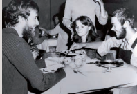
Mittagessen in den 1980er Jahren Lunch in the 1980s