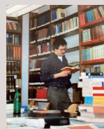
Blick in die alte Bibliothek des Sprachenkonvikts, um 1990 View of the old library of the Language Konvikt, around 1990 Bundesarchiv

The Language Konvikt kept up a special connection to the Church College in Zehlendorf. Its lecturers traveled to East Berlin as private visitors and held lectures at the Language Konvikt. The same was true for guests from West Germany and other countries. There were also foreign